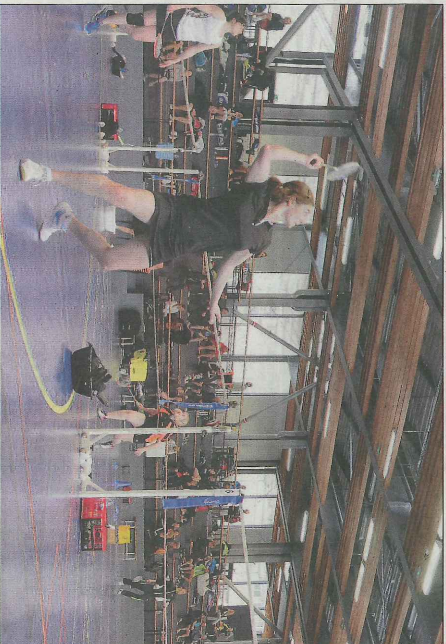
Retardées par la pluie tombant du toit, les rencontres se sont terminées après 19 heures. Mais quel spectacle tout au long de cette journée !

« Nous avons fini très tard. Les dernières rencontres se sont terminées après 19 heures,